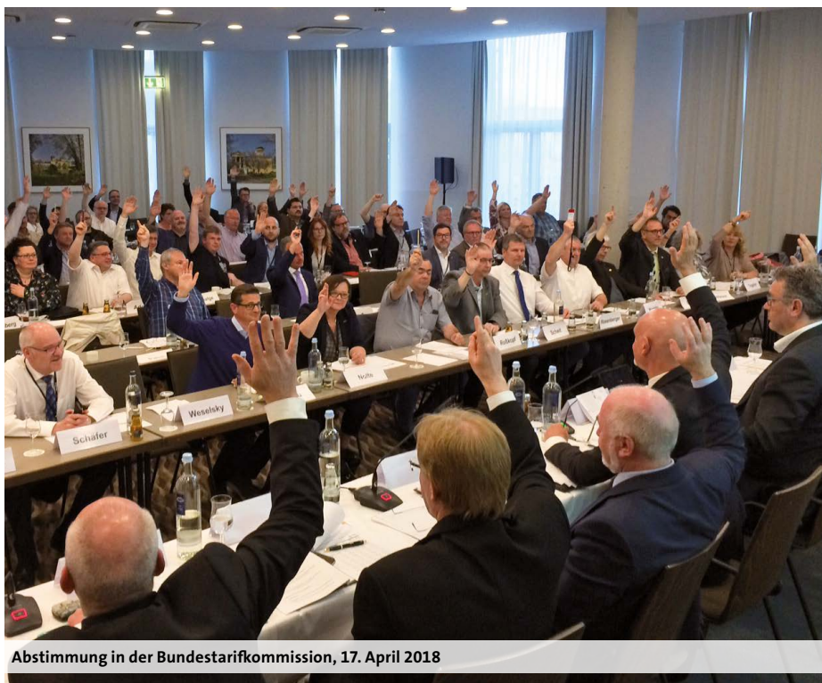
Abstimmung in der Bundestarifkommission, 17. April 2018

Darüber hinaus wird der Urlaubsanspruch der Auszubildenden, Praktikantinnen und Praktikanten nach TVAöD-BBiG, TVAöD-Pflege und TVPöD ab dem Urlaubsjahr 2018 bei einer 5-Tage-Woche von 29 auf 30 Arbeitstage erhöht. Die bisherige Übernahmeregulung wird über die Mindestlaufzeit der Entgeltregelungen hinaus bis einschließlich Oktober 2020 vereinbart.