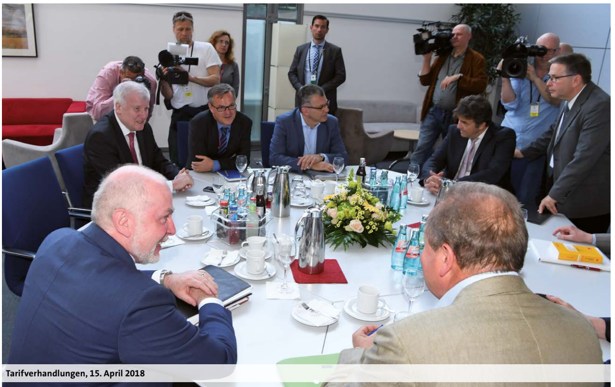
Tarifverhandlungen, 15. April 2018

Die Erhöhungen im Bereich der Fleischuntersuchung betragen ab dem 1. März 2018 3,19 Prozent, ab 1. April 2019 weitere 3,09 Prozent und ab 1. März 2020 1,06 Prozent.