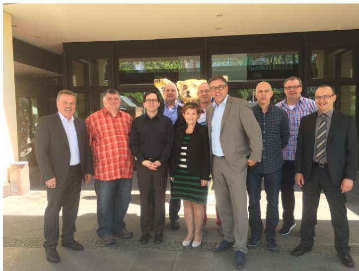
Verhandlungskommission des dbb

Die Verhandlungen werden im Sommer 2017 fortgesetzt.