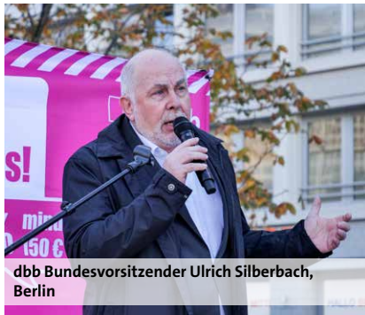
dbb Bundesvorsitzender Ulrich Silberbach, Berlin