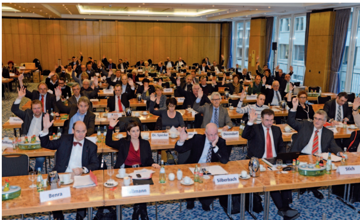
Die dbb-Gremien beschließen über die Forderung

In diese Stärke muss investiert werden. Wer denkt, starke Länder kann es zum Nulltarif geben, irrt. Die Rechnung lautet vielmehr: Starke Länder gibt es nur durch faire Löhne!