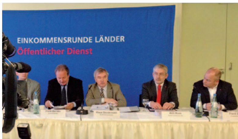
Pressekonferenz nach dem Forderungsbeschluss am 11. Dezember 2012